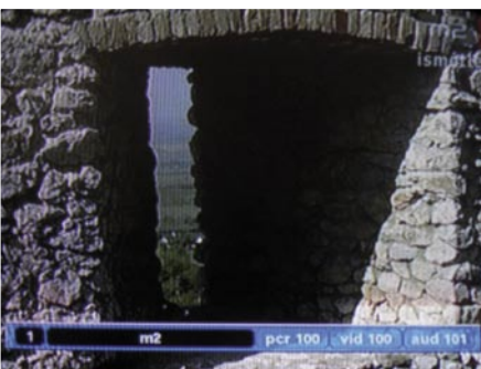
Belka informacyjna |