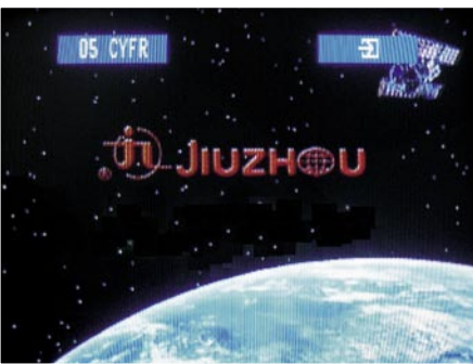
Ekran powitalny |