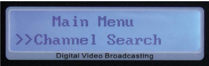
Wyszukiwanie kanałów |