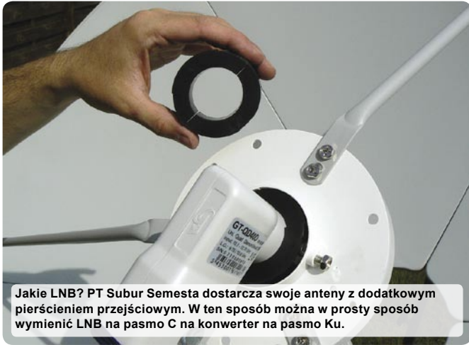
Jakie LNB? PT Subur Semesta dostarcza swoje anteny z dodatkowym pierścieniem przejściowym. W ten sposób można w prosty sposób wymienić LNB na pasmo C na konwerter na pasmo Ku.