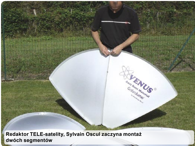
Redaktor TELE-satellite, Sylvain Oscul zaczyna montaż dwóch segmentów