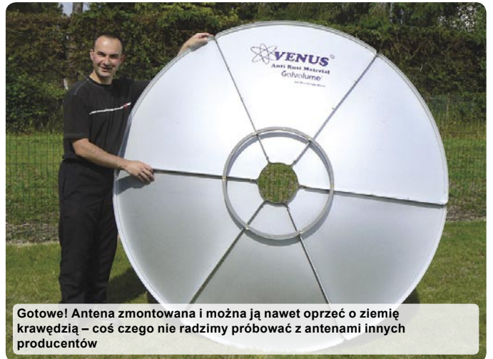
Gotowe! Antena zmontowana i można ją nawet oprzeć o ziemię krawędzią – coś czego nie radzimy próbować z antenami innych producentów