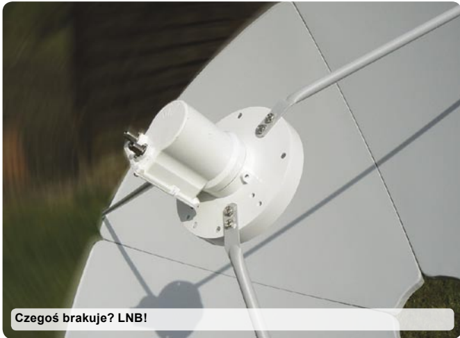
Czegoś brakuje? LNB!