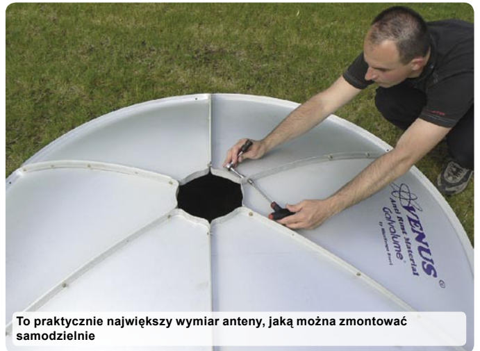
To praktycznie największy wymiar anteny, jaką można zmontować samodzielnie