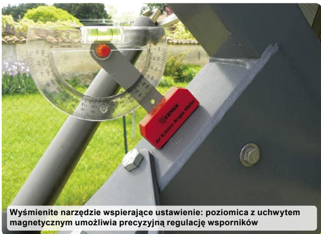
Wysmienite narzędzie wspierające ustawienie: poziornica z uchwytem magnetycznym umożliwia precyzyjną regulację współników