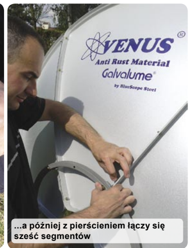
...a później z pierścieniem łączy się sześć segmentów