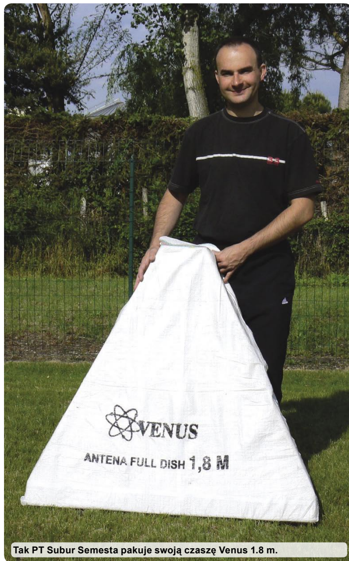
Tak PT Subur Semesta pakuje swoją czaszę Venus 1.8 m.

Uchwyty falowodu czaszy Venus przeznaczone są dla standardowych falowodów na pasmo C, co pozwala skorzystać z typowego produktu ze sklepu. Nie spodziewaliśmy się tego, ale bardzo doceniliśmy