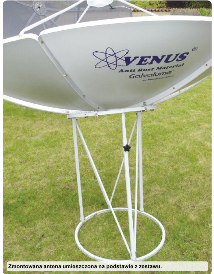
Zmontowana antena umieszczona na podstawie z zestawu.