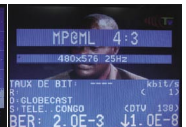
Jeden z kanałów NSS7