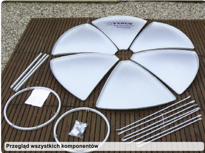
Przegląd wszystkich komponentów