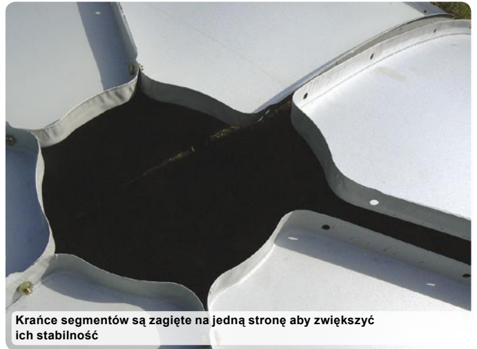
Krańce segmentów są zagięte na jedną stronę aby zwiększyć ich stabilność