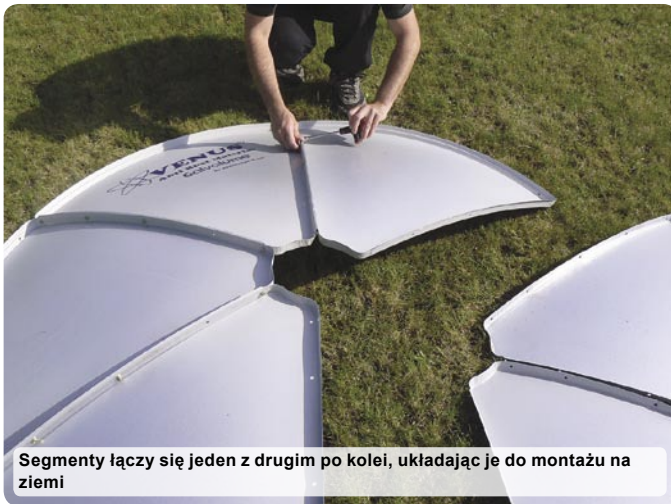
Segmenty łączy się jeden z drugim po kolei, układając je do montażu na ziemi