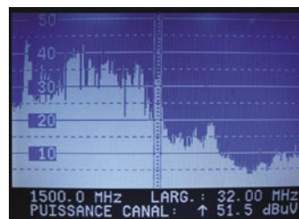
Widmo NSS7 na 338E (22W)