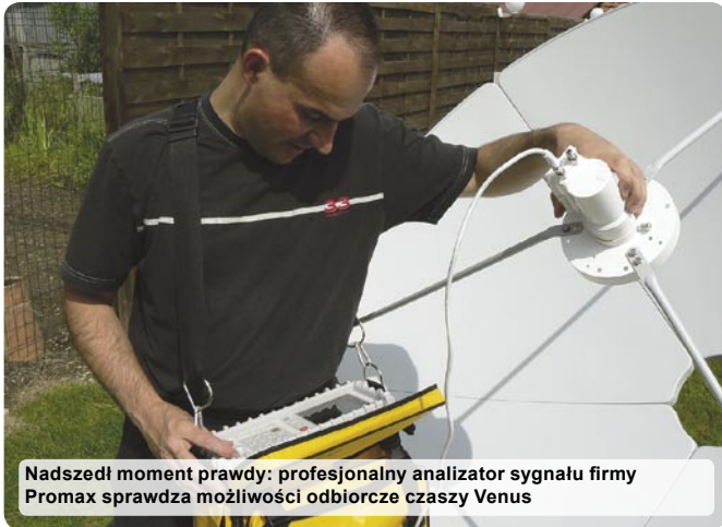
Nadszedł moment prawdy: profesjonalny analizator sygnału firmy Promax sprawdza możliwości odbiorcze czaszy Venus