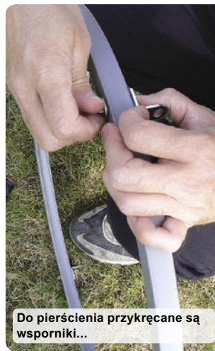
Do pierścienia przykręcane są wsporniki...